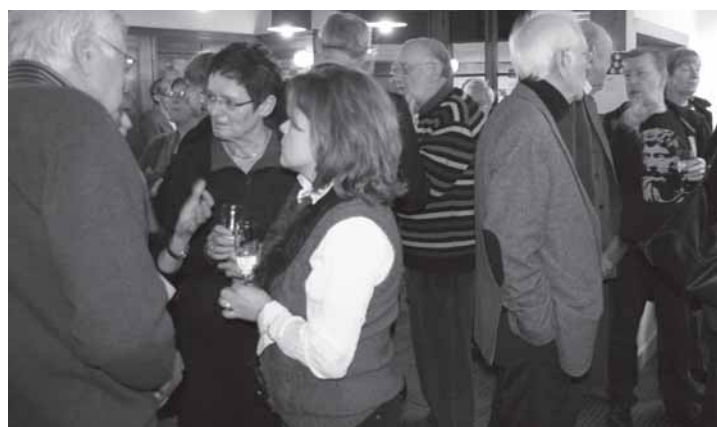
Nieuwjaarsreceptie - 23 januari 2011