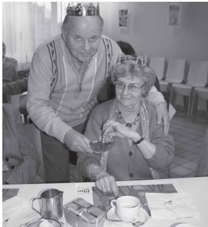
3 Koningenfeest - 6 januari 2011